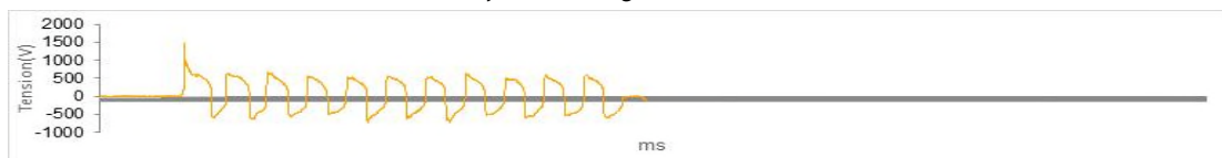
Gráfico de la respuesta de los sensores de referencia

Gráfico da resposta dos sensores de referência